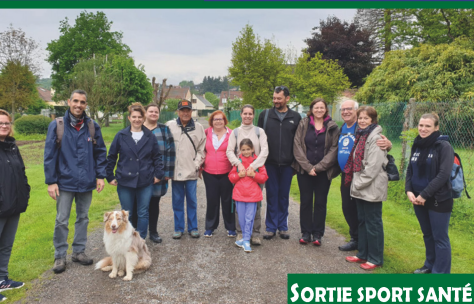
SORTIE SPORT SANTÉ