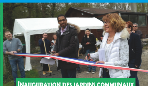
INAUGURATION DES JARDINS COMMUNAUX