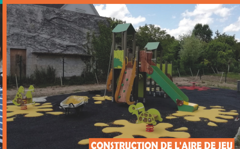
CONSTRUCTION DE L'AIRE DE JEU