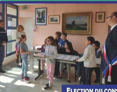
ELECTION DU CONSEIL DES ENFANTS