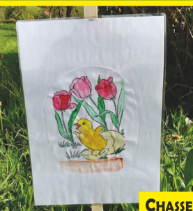
CHASSE AUX OEUFS